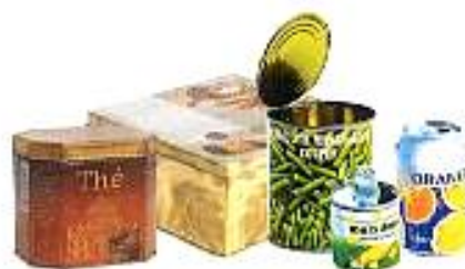
Boîtes de gâteaux, à thé, de conserve... et boîtes de boisson