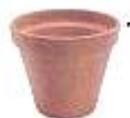
Pots de fleurs