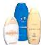
Flacons de produits de toilette