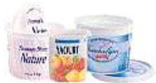
Pots de produits laitiers

Non recyclés dans le bac à couvercle vert