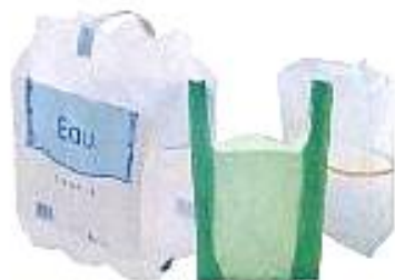
Suremballages, sacs, films en plastique