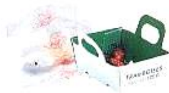
Papier et boîtes en carton salis, ou contenant des restes