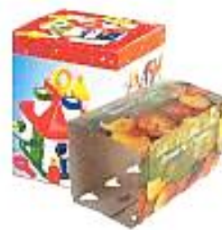
Boîtes et suremballages en carton