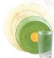
Vaisselle, faïence, porcelaine

Non recyclés dans le bac à couvercle vert