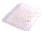
Barquettes en polystyrène