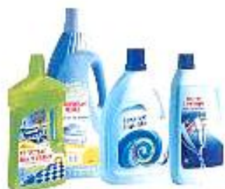
Flacons de produits ménagers...