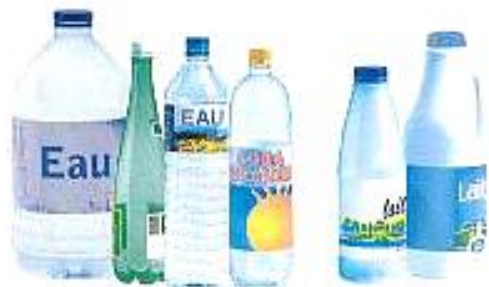
Bouteilles d'eau, de jus de fruit, de soda, de lait, de soupe...

A recycler dans le bac à couvercle jaune (bien vider les emballages)