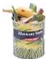
Boîtes contenant des restes

Non recyclés dans le bac à couvercle vert