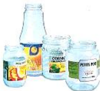
Bocaux de conserve